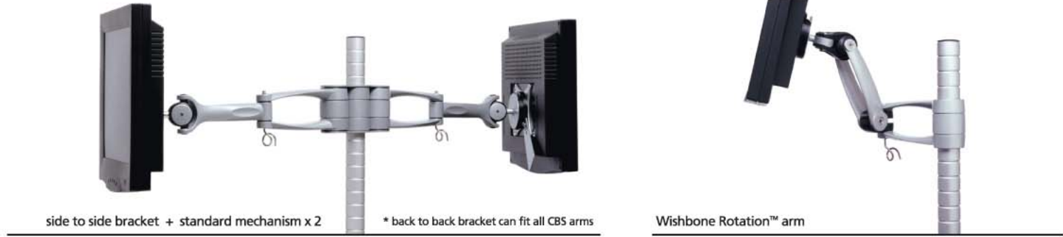
side to side bracket + standard mechanism x 2

* back to back bracket can fit all CBS arms