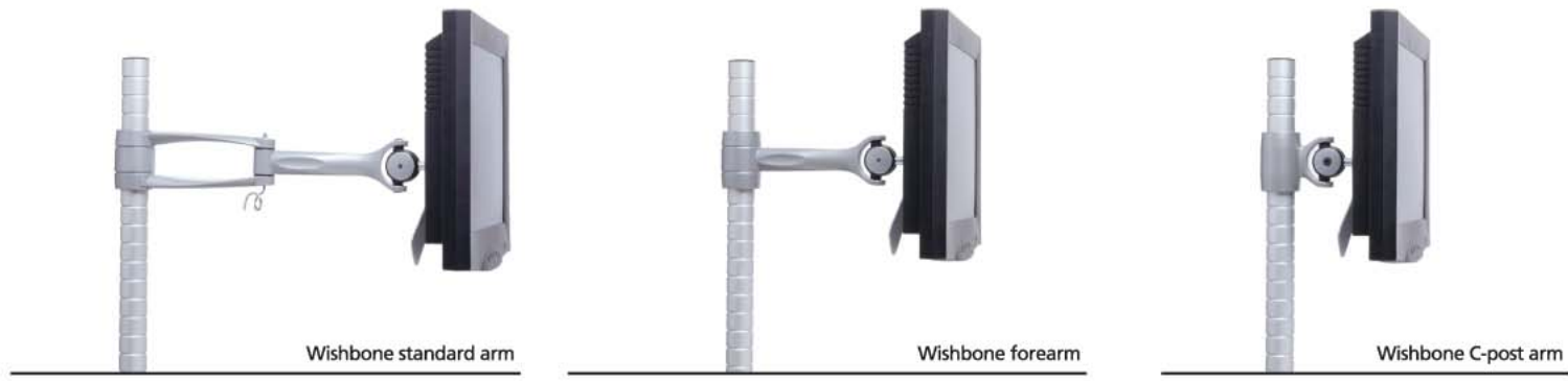
Wishbone standard arm