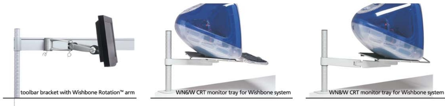
toolbar bracket with Wishbone Rotation™ arm