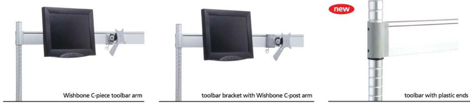
Wishbone C-piece toolbar arm